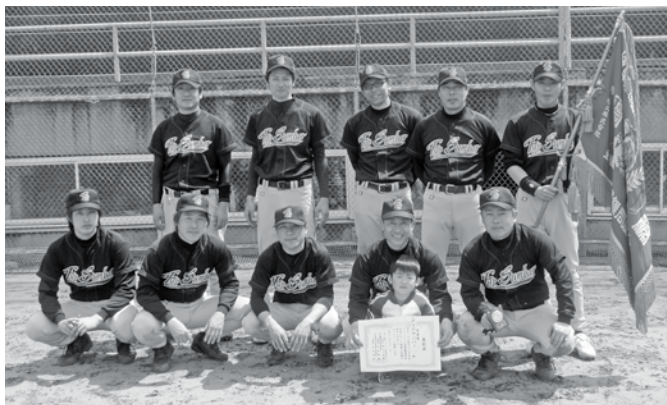
準優勝のFYPサンバー

第58回岐阜ファッション産業親善野球大会(社岐阜ファッション産業連合会・岐阜織維健康保険組合・岐阜織維卸売業厚生年金基金主催。岐阜市・岐阜新聞・岐阜放送・岐阜市軟式野球連盟後援)は春たけなわの4月17日、18日の両日、岐阜市の市民球場他で行なわれ、決勝はビッグビーツとFYPサンバーと対戦。