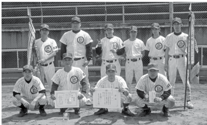
優勝のビッグビーツ

第58回岐阜ファッション産業親善野球大会(社岐阜ファッション産業連合会・岐阜織維健康保険組合・岐阜織維卸売業厚生年金基金主催。岐阜市・岐阜新聞・岐阜放送・岐阜市軟式野球連盟後援)は春たけなわの4月17日、18日の両日、岐阜市の市民球場他で行なわれ、決勝はビッグビーツとFYPサンバーと対戦。