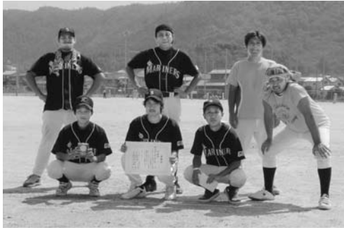
準優勝 サンラリーマリナーズ

9月11日(土) 1回戦 4試合 諏訪山グラウンド 2回戦 4試合 " 9月12日(日) 準決勝 2試合 " 3位決定戦 1試合 " 優勝戦 1試合 "