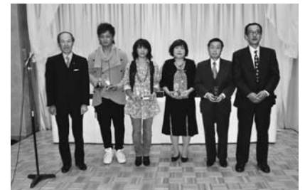
ベストコーディネート入賞者の方々