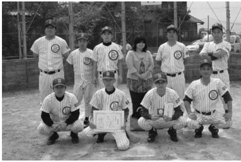
準優勝 ビッグビーツ