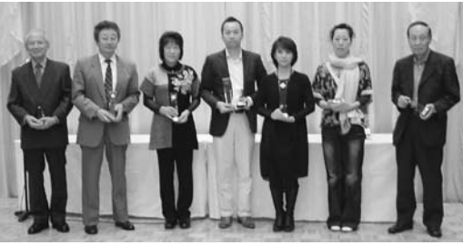
ベストコーディネーター入賞者の方々