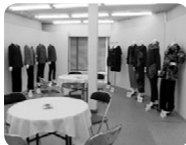
ギフコレ 中西部・東部展示会場