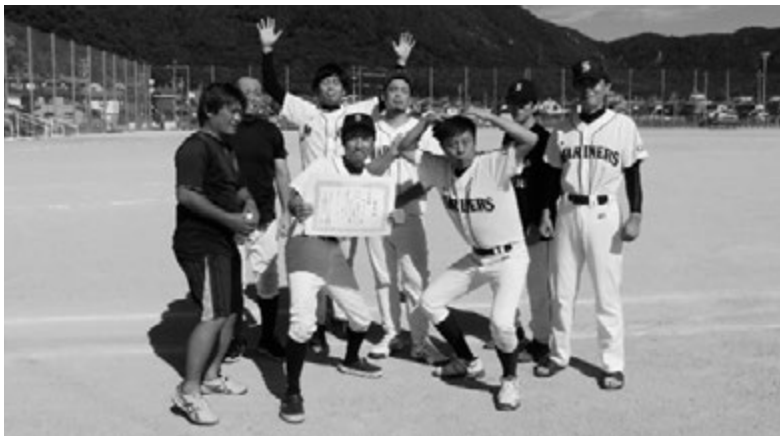
準優勝 サンラリーマリナーズ