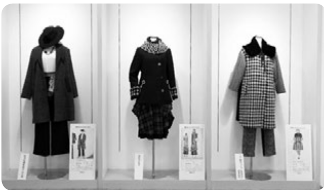
岐阜マザーズコレクション受賞作品