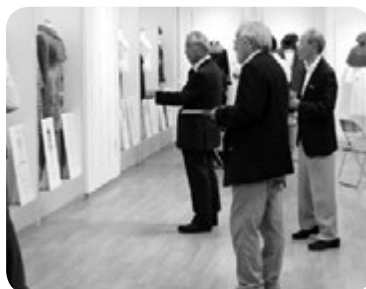
マザーズコレクション審査