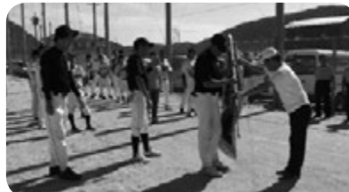
宮田昭福祉委員長より優勝旗授与