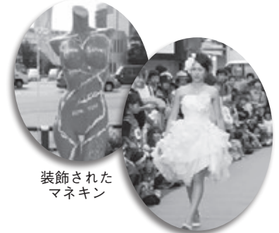
装飾された マネキン

尚、会場ではヒップホップや演歌、ダンス、ファッションショーなども開催されました。岐阜アパレルとアーティストらの創作力で新たな風を吹き込み、将来は問屋街に出展するようになってほしいとの願いでイベントを開催。多くの一般客で賑わいました。