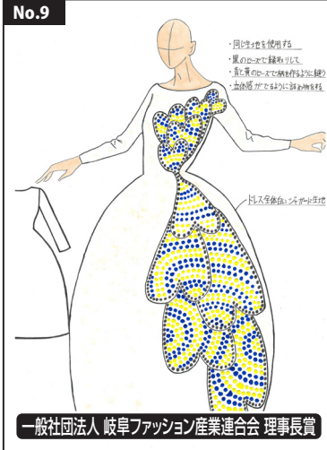
一般社団法人 岐阜ファッション産業連合会 理事長賞