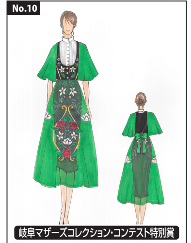
岐阜マザーズコレクション・コンテスト特別賞